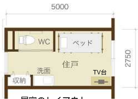
居室のレイアウト