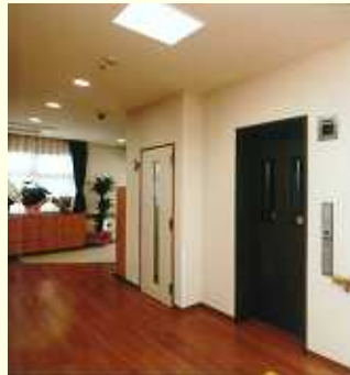
エレベーター エントランス看板